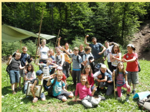
WILD niscamp !!!

18 Kinder und 2 Lehrerinnen machten sich an einem heißen Mittwoch im Juni in die Wildnis auf ins Kirnbachtal bei Tübingen. Das Schullandheim sollte aufregend und spannend werden, so wünschten es sich die Kinder. Empfangen durch vier Betreuer der Organisation "Wildniswandern" folgte nach einem halbstündigen Marsch der Zeltaufbau auf einer Waldwiese, die von einem kleinen kühlenden Bächlein und einer naturellen "Kletterwand" gesäumt wurde. Das Baden und Spielen im Bach und das Klettern waren die größte Freude der Kinder in den kommenden drei heißen Tagen. Jedoch lernten wir auch mit welchem Material man ein Feuer mit nur einem Streichholz entfacht und wie man durch Glutbrennen und Schnitzen einen eigenen Löffel aus Holz herstellt. Nach einigen Schleich- und Orientierungsspielen ließen wir diesen Tag mit Würstchen, Grillkäse, Stockbrot und gebackene Schokobanane am Lagerfeuer ausklingen. Bevor es jedoch in die Zelte zum Schlafen ging, machten sich alle noch zu einer Nachtwanderung ohne Taschenlampen quer durch den Wald auf ... das war sehr aufregend und unheimlich!